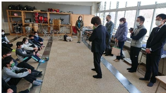
発表会への訪問、助言