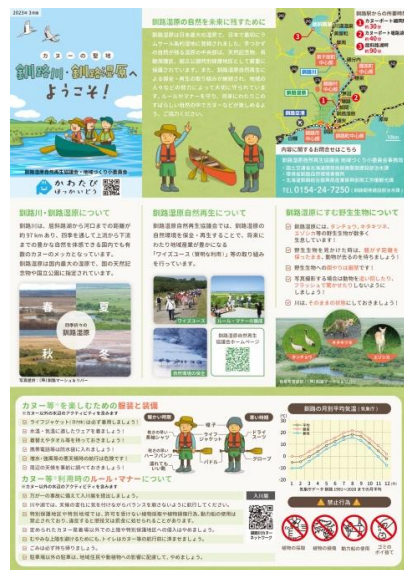
カヌーガイドライン（改訂版）