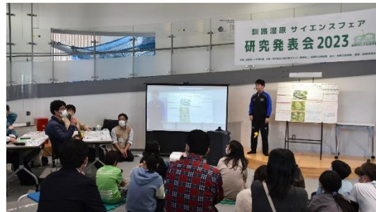
研究発表会の開催