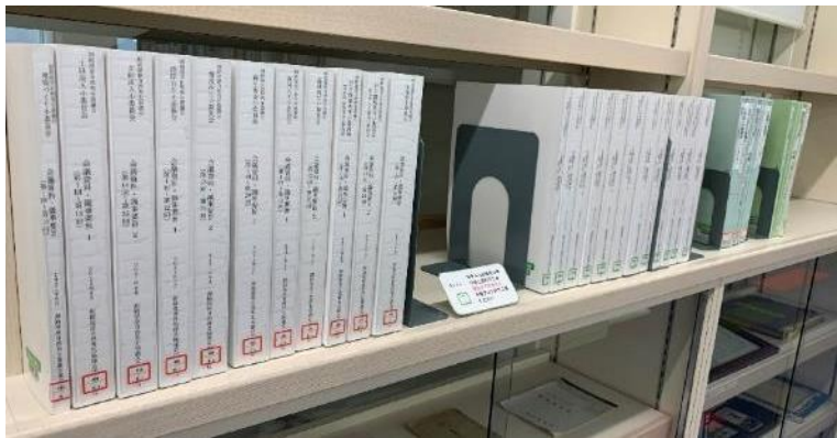
釧路市中央図書館 収蔵資料