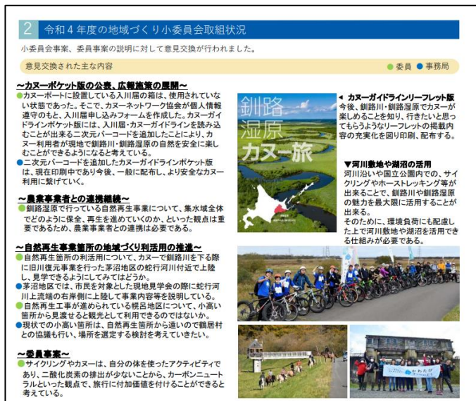
地域づくり小委員会ニュースレターより